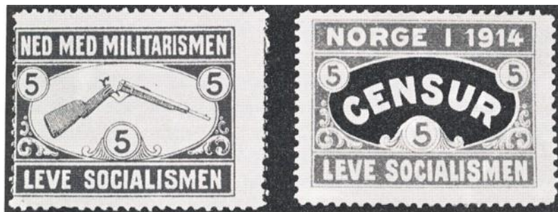
Ungdomsforbundets brevmerke fra 1914 med det brukne gevær, i usensurert og sensurert utgave.

Antimilitarismen sto sterkt i arbeiderbevegelsen helt fra partiets dannelse i 1890-årene. Motstanden mot militæret fortsatte under 1. verdenskrig, den styrket seg frem mot 1917. Regjeringen foreslo en sterk økning av bevilgninger til militæret. Arbeiderne syntes det var galskap å bruke masse penger på våpen når folk sultet. De ville heller ha «dyrtidstillegg» i lønna for å bøte på den nøden som rådde blant det arbeidende folk. De ville også at AP skulle vedta almen militærstreik på programmet, som vi så skjedde ikke dette.